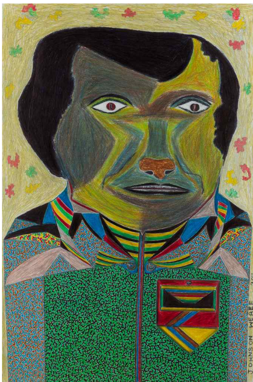
Johnson Weree, Untitled, 2011, mixed media on op paper, 50 x 32,5 cm, acquisition 2012 / verworven in 2012